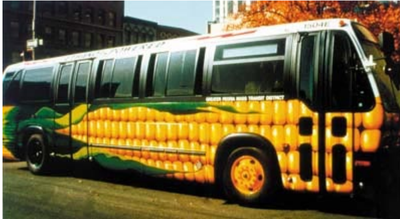
Autobús alimentado con una mezcla de gasolina y alcohol obtenido del maíz

Biomasa, abreviatura de masa biológica, cantidad de materia viva producida en un área determinada de la superficie terrestre, o por organismos de un tipo específico. Este término es utilizado con mayor frecuencia para referirse a la energía de biomasa, es decir, al combustible energético que se obtiene directa o indirectamente de recursos biológicos.